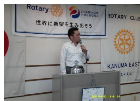
青少年奉仕委員長 就任挨拶