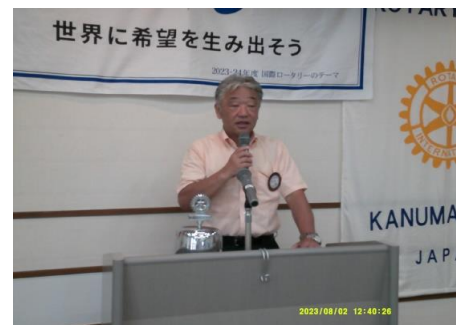
ボーリング大会よろしく!