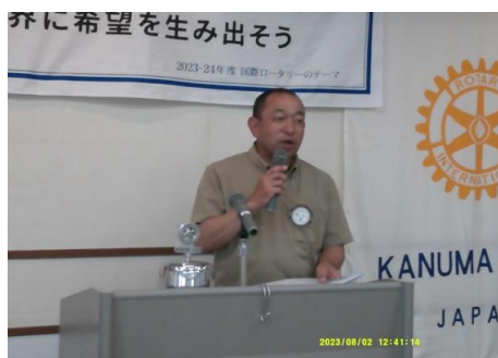
納涼家族会 楽しみに!