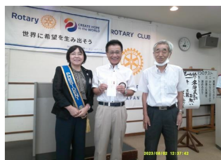
8月度 在籍年数表彰