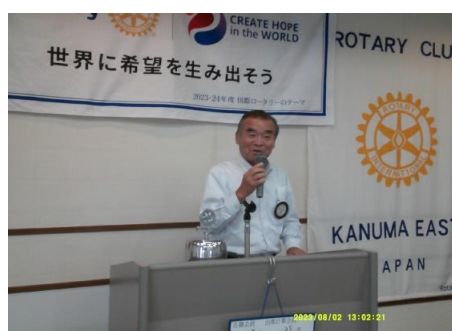
米山委員長 就任挨拶