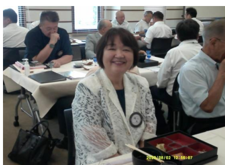
横川会員 待ってました