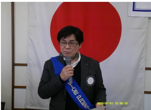
クラブ管理運営常任委員長