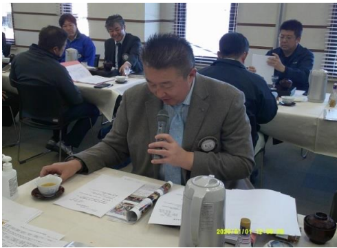
ローター情報委員長