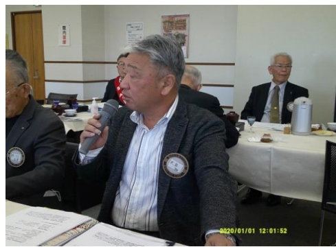
奉仕プロジェクト常任委員長 社会奉仕委員長