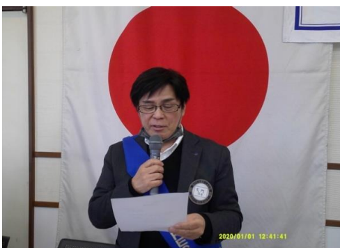
スマイル会計委員長代理