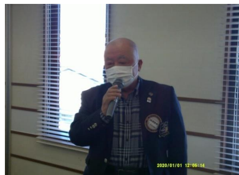
ローター財団常任委員長