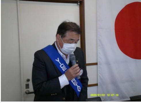
広報常任委員長 広報資料委員長