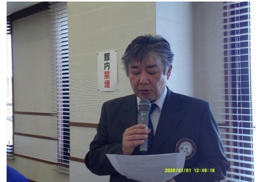
会員増強常任委員長 会員増強委員長