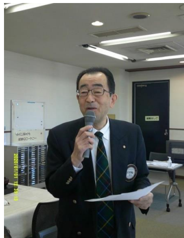
プログラム委員長