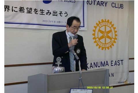
プログラム委員長より 講師紹介