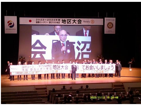
次期地区大会ホストクラブ 鹿沼RC