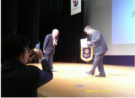
転ばなくて良かった