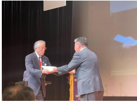
ポリオ活動 ガバナー賞