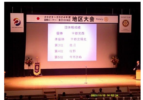
記念ゴルフ大会 入賞なし 残念