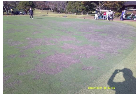
1500円割引のグリーン