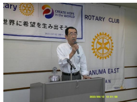
プログラム委員長