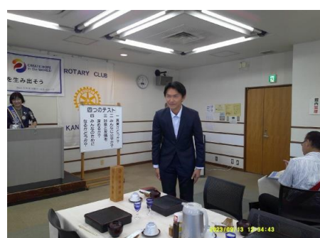
仲田次期市会議員