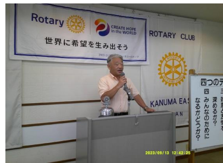
ボーリング大会はお疲れ様でした