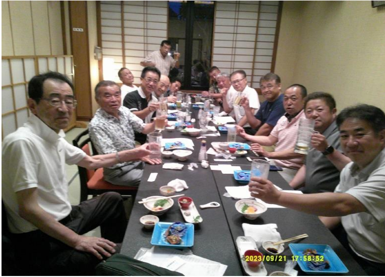
表彰式 みしまにて