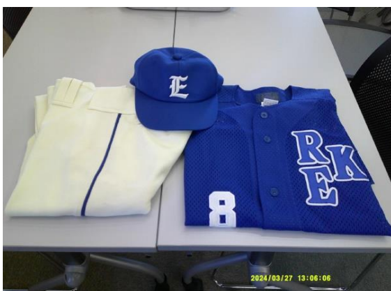
野球部ユニフォーム