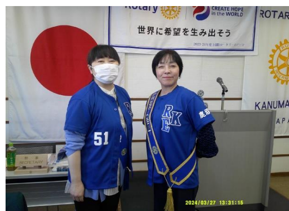
マネージャー お似合いです