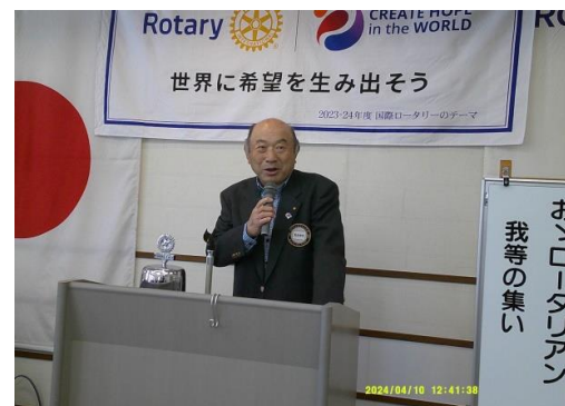
納会コンペ 出席してね