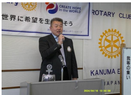
他クラブへのメークよろしく