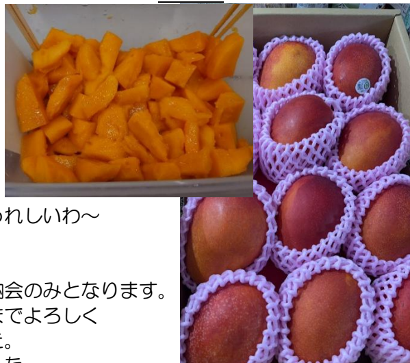
斗六RC 金希仁様 マンゴー ありがとうございます とても美味でした！